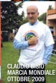
CLAUDIO BISIO MARCIA MONDIALE OTTOBRE 2009