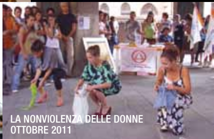
LA NONVIOLENZA DELLE DONNE OTTOBRE 2011