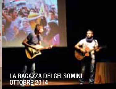
LA RAGAZZA DEI GELSOMINI OTTOBRE 2014