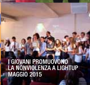
I GIOVANI PROMUOVONO LA NONVIOLENZA A LIGHTUP MAGGIO 2015