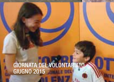
GIORNATA DEL VOLONTARIATO GIUGNO 2015