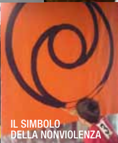
IL SIMBOLO DELLA NONVIOLENZA