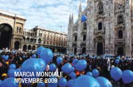
MARCIA MONDIALE NOVEMBRE 2009