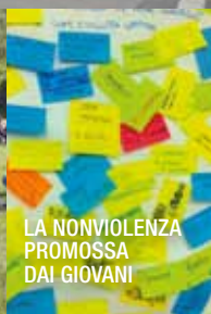
LA NONVIOLENZA PROMOSSA DAI GIOVANI