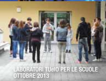
LABORATORI TUeIO PER LE SCUOLE OTTOBRE 2013