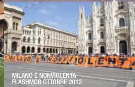
MILANO È NONVIOLENTA FLASHMOB OTTOBRE 2012