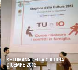
SETTIMANA DELLA CULTURA DICEMBRE 2012